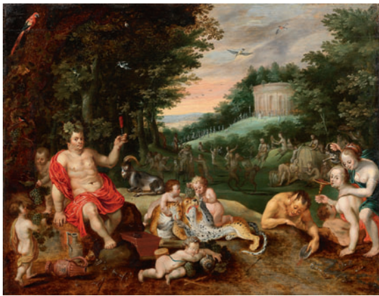
Lot 1123 - Erlös 93.500,- €

Das Toplos unter den Altmeistern – das in den 1630er Jahren entstandene, figurenreiche „Bacchanal in bewaldeter Landschaft“ Jan Brueghel des Jüngeren – sicherte sich ein deutscher Sammler für 93.500,- Euro (Lot 1123).