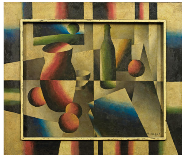
Lot 1360 - Erlös 77.500,- €