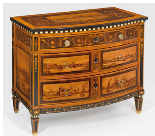
Lot 1498 - Erlös 50.000,- €

ze mit Sphingenfiguren aus feuervergoldeter Bronze, die einst als repräsentative Schaustücke eines Palais' bzw. Schlosses dienten und die nun 35.000,- Euro erlösten (Lot 1479). Eine flämische Tapiserie mit einer Bacchanal-Szene in parkartiger Landschaft, die um 1670-1690 in Antwerpen gefertigt wurde, spiegelte in authentischer Weise die Prachtenfaltung des Barock wider und wurde nicht zuletzt aufgrund ihres guten Erhaltungszustandes engagiert beboden und auf 25.000,- Euro gesteigert (Lot 1557; Taxe 8.500,- €).