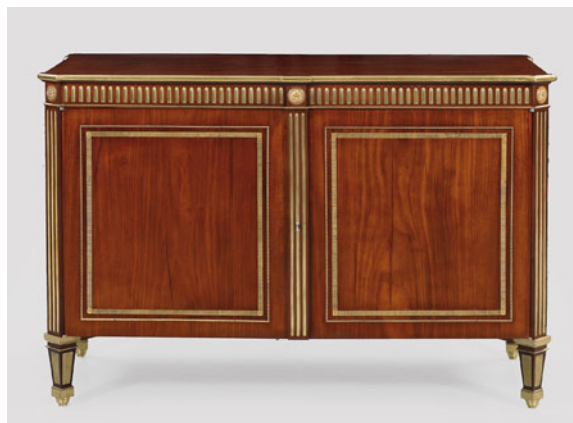
Lot 1483 - Erlös 131.000,- €

reiche Aufträge für Zarin Katharina II. die Große von Russland auszuführen. Unmittelbar in der russischen Residenzstadt an der Newa entstand um 1800 eine hochqualitative Louis XVI-Kommode mit reich intarsiierten Petersburg-Ansichten. Durch internationale Gebote stieg sie auf beachtliche 50.000,- Euro (Lot 1498; Taxe 12.500,- €). Mit deutlich über den Schätzpreisen liegenden Ergebnissen vollständig abgesetzt werden konnte das Angebot an Braunschweiger Barock-Möbeln aus dem direktem Besitz der bedeutenden Adels- und Kaufmannsfamilie von Löbbbecke. Pierre-Philippe Thomire, der u.a. für die Kaiserfamilie Bonaparte und die Bourbonen arbeitete, fertigte um 1815 ein Paar Tafelaufsätze