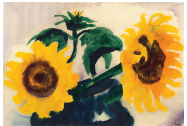
Lot 1359 - Erlös 118.500,- €

Unterschiedliche Positionen in der Kunst der 1920/30er Jahre repräsentieren ein farbenfreudiges expressionistisches „Sonnenblumen“-Aquarell des „Brücke“-Künstlers Emil Nolde und ein kubistisches Stillleben des Avantgarde-Künstlers Arthur Segal, das 1924 in Berlin entstand. Während Noldes „Sonnenblumen“ im Saal für 118.500,- Euro zugeschlagen wurde (Lot 1359), entbrannte um Artur Segals marktfresches, direkt danach aufgerufenes Stillleben eine Bietschlacht unter neun internationalen Telefonbieterern. Es ging für 77.500,- Euro an eine Schweizer Sammlerin (Lot 1360; Taxe 28.000,- €). Mit einem Sprung in die Gegenwart führt der marokkanische Maler Hassan El Glaoui (geb. 1924), der bisher vor allem im französischsprachigen Raum bekannt ist und aus diesem eine große Bieterschar anzog. Sein „Festlicher Reiterzug des Sultans mit seinem Gefolge“ konnte seinen Schätzwert mehr als verzehnfachen – der Zuschlag von 56.000,- Euro markiert den zweithöchsten Auktionspreis für ein Gemälde El Glaouis.